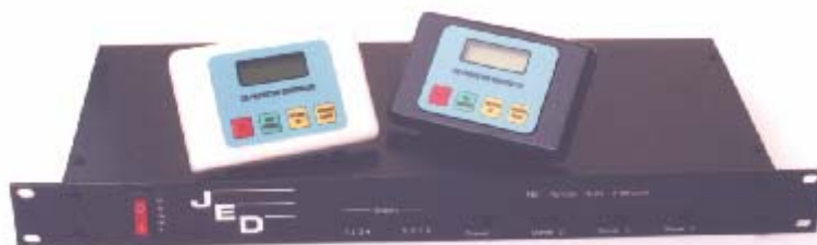
Le contrôleur audio avec le contrôleur RS232

Le contrôleur audio avec relais dispose en plus du contrôleur standard de 8 relais permettant la commande de stores, écran, lumière, etc. Les commandes sont programmable par le port RS-232. Les états des relais sont visibles en face avant.