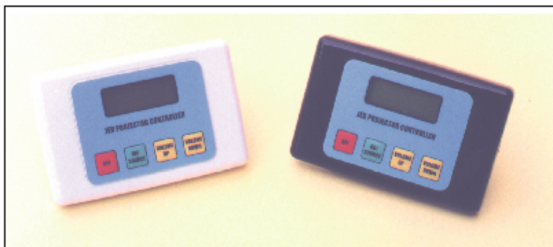
Le panneau de commande T460 disponible en noir et blanc

Le boîtier de commande (110 x 70 mm) est disponible en noir ou blanc, comprend un affichage LCD rétro-éclairé et peut être placé partout, y compris sur un pupitre d'orateur.